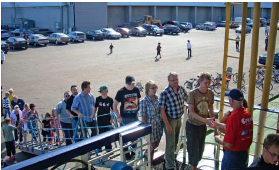
En stridström av förväntansfulla besökare i Piteå. Sammanlagt hade Sjöfartskaravanen 13 068 besökare ombord på Ymer.

mallar för PR-material m.m.), Rederi AB Transatlantic personalchef, SUI och denna artikels författare fanns. Projektledning och webbredaktörskap sköttes av Sveriges Redareförening.