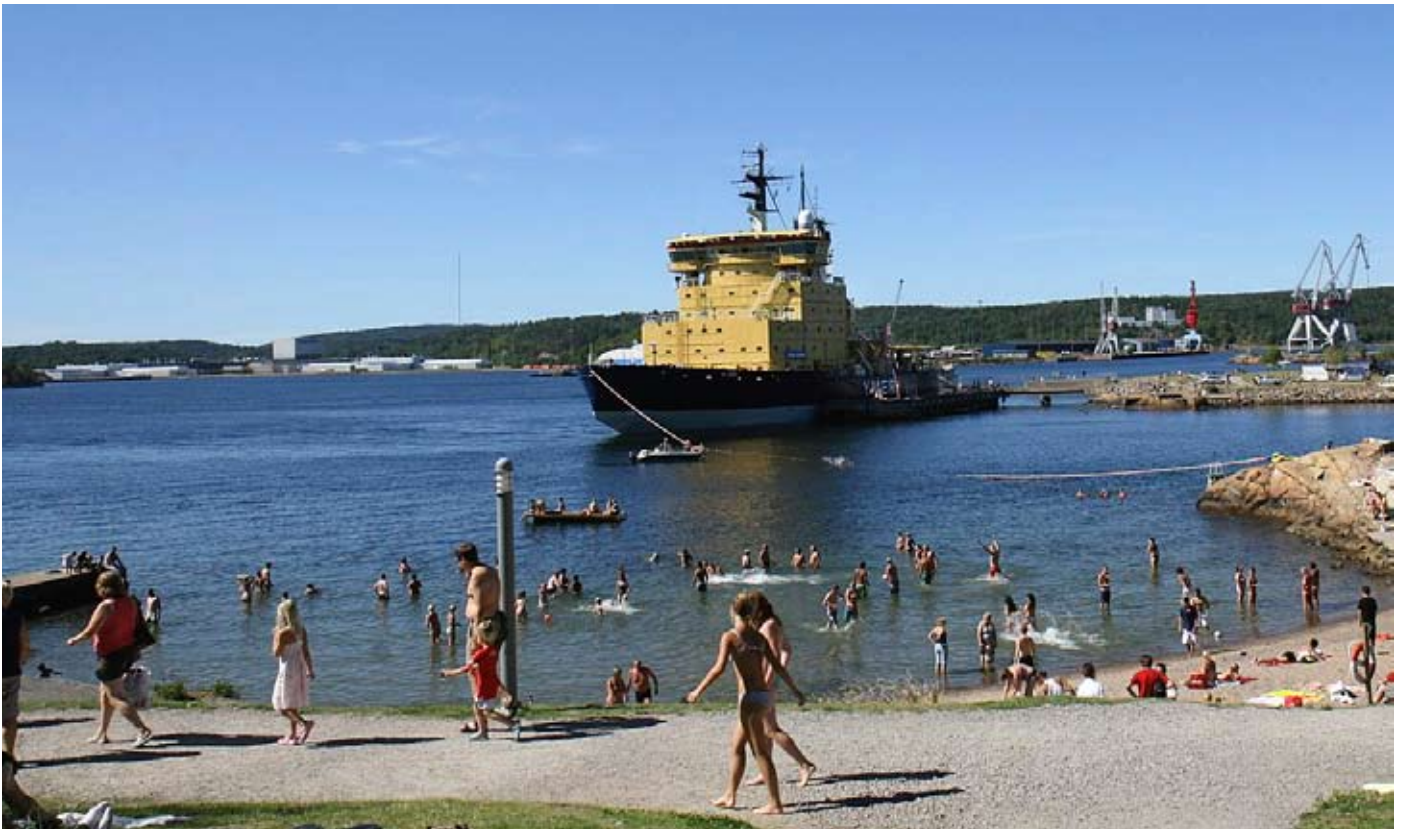
Sjöfartskaravanen med isbrytaren Ymer mitt i Uddevallas badplats i 30-gradig sommarvärme.